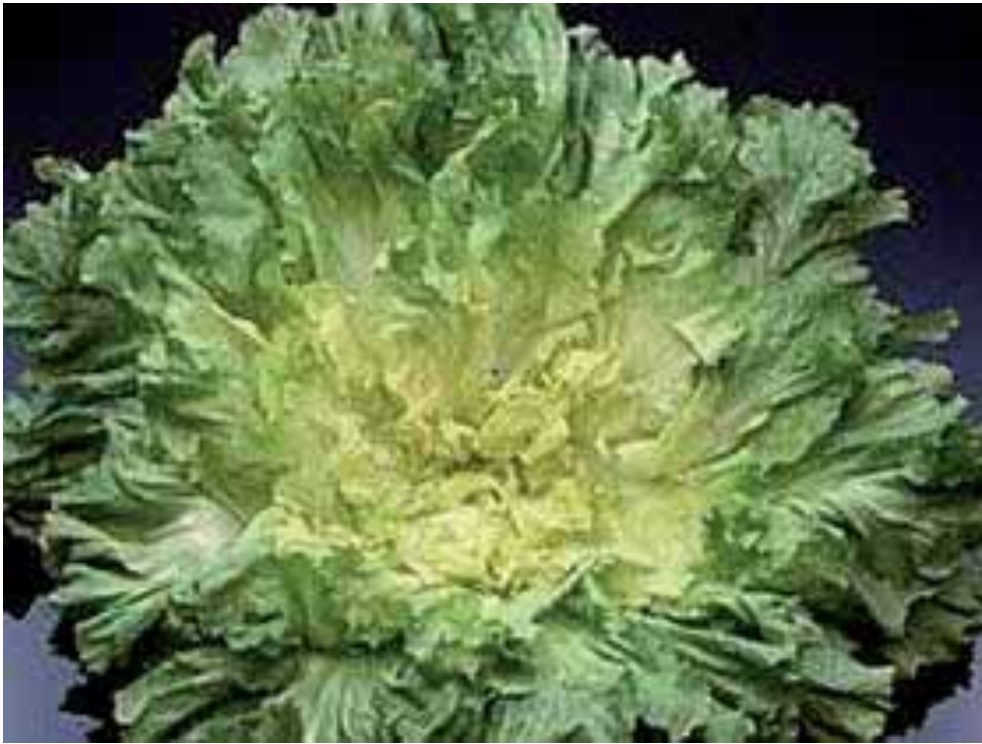
endivija: pretežno samoprašna