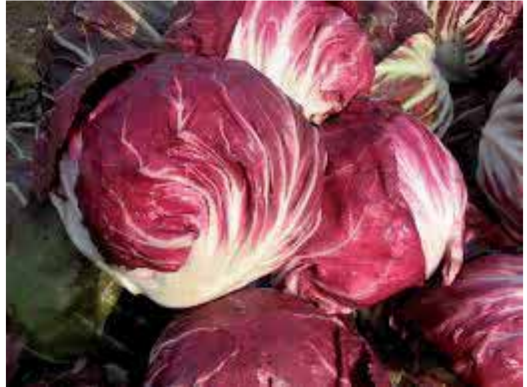
radič: tujeprašnica, število hibridov se povečuje; potrošnik je ista vrsta!